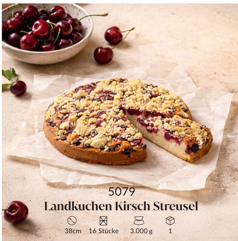
5079 Landkuchen Kirsch Streusel