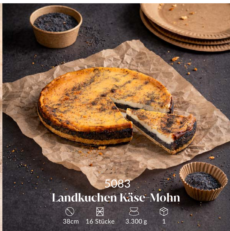
5083 Landkuchen Käse-Mohn