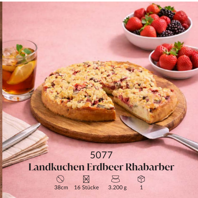
5077 Landkuchen Erdbeer Rhabarber